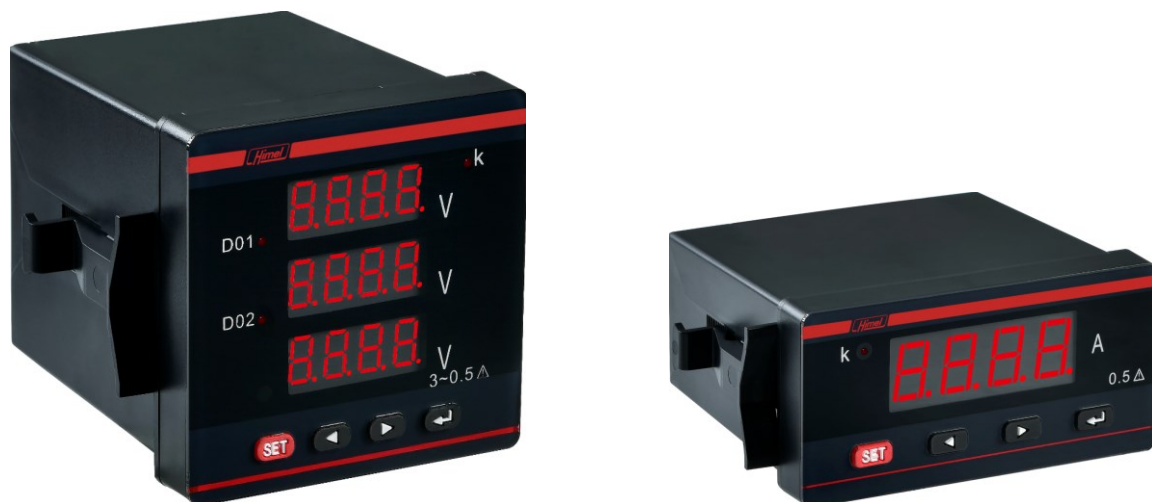
Рисунок 2 - Общий вид амперметров и вольтметров

Пломбирование амперметров и вольтметров не предусмотрено.