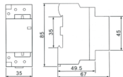
Рис. 2 Внешний вид контакторов МК-103 16-25А (04, 31, 22, 40); МК-103 32-63А (11, 20, 02)