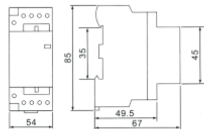
Рис. 3 Внешний вид контакторов МК-103 32-63А (04, 31, 22, 40)